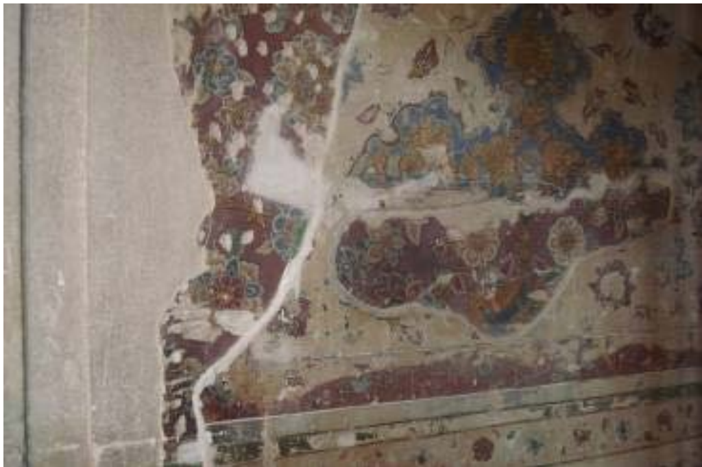
شکل ۱: لایه‌های نقاشی که روی هم اجرا شدند، کاخ چهل ستون اصفهان، (نگارندگان، ۱۳۹۰).