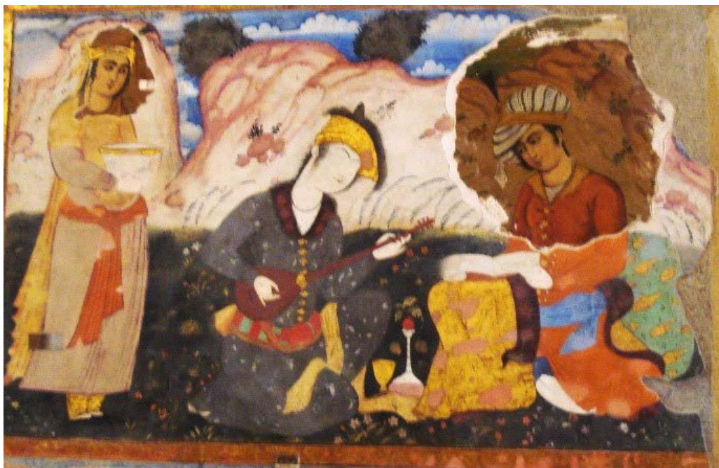
شکل ۵: نگاره کاخ چهل ستون با نمونه شاهد از تعمیرات منتسب به میرزا آقا امامی (نگارندگان، ۱۳۹۰). Fig. 5: The illustration of the Chehel Sotoun Palace with a evidence of repairs attributed to Mirza Agha Imami (Author, 2011).