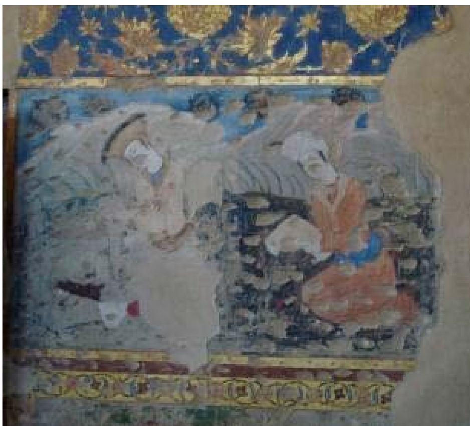
شکل ۳: آزاد شدن لایه نقاشی زیرین (نقاشی اصلی) از لایه الحاقی و نمایان شدن سطح تیشه‌ای آن، کاخ چهل ستون اصفهان. Fig. 3: The release of the underlying painting layer (original painting) from the overlay layer and the exposure of its plinth surface, Chehel Sotoun Palace, Isfahan.