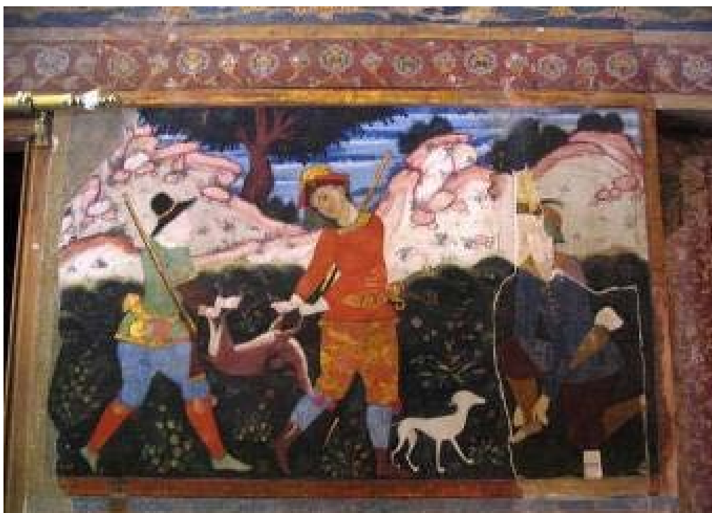
شکل ۶: نمونه بازسازی نقطه کمبود مربوط به دوره پهلوی که به دلیل نبودن نقاشی در زیر این لایه، این لایه مرمتی نگه داشته شده است، چهل ستون (نگارندگان، ۱۳۹۰).