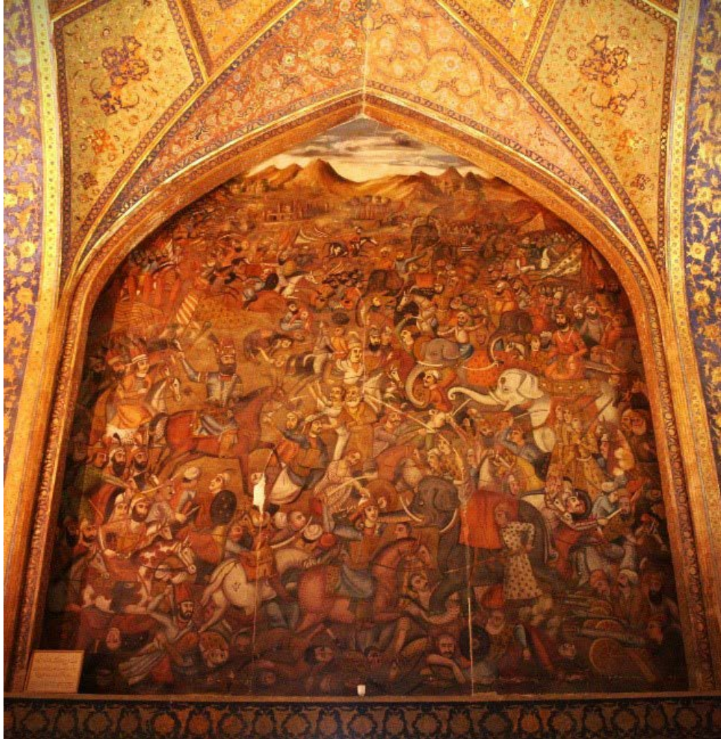
شکل ۷: تابلوی جنگ چالدران، کاخ چهل ستون اصفهان (نگارندگان، ۱۳۹۰).

دوره اجرا شده تا به مخاطب نزدیک‌تر باشد و محتوای آن در گذشته محبوس نماند که از این طریق قابل دریافت و فهم بیشتر در دوره زمانی و مخاطب عصر خود باشد.