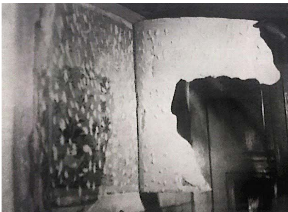
شکل ۲: جداسازی لایه نقاشی الحاقی (لایه نقاشی برین) از روی نقاشی اصلی (لایه زیرین)، کاخ چهل ستون (زاندر، ۱۳۹۶). Fig. 2: Separation of the upper painting layer (overlay layer) from the main painting (lower layer), Chehel Sotoun Palace (Zander, 1396).